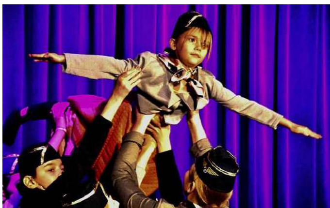
Fot. Sebastian Kozłowski