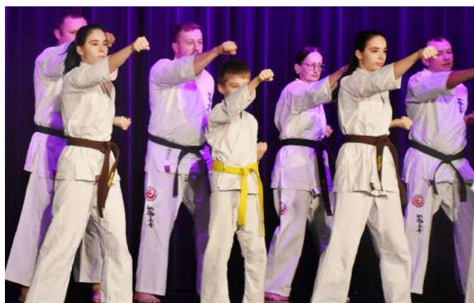
Fot. Sebastian Kozłowski