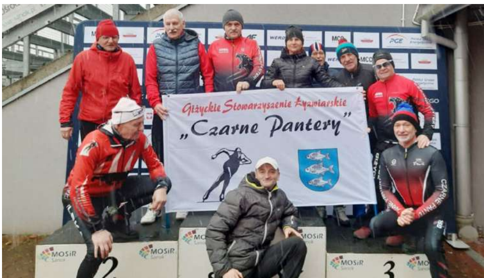
W tym sezonie giżyccy łyżwiarze po punkty Pucharu Polski dwukrotnie jeździli do Tomaszowa Mazowieckiego i raz do Sanoka. Ta fotka pochodzi z tego ostatniego

Czekamy zatem na wyniki, zamykające najnowszy rozdział w historii GSŁ. A tych, którzy chcieliby nieco zanurzyć się w historii, gorąco zachęcamy do odwiedzenia Giżyckiego Archiwum Cyfrowego (ul. Warszawska 17). Można tam bowiem obejrzeć ciekawą wystawę fotograficzną poświęconą "Czarnym Panterom" (wernisaż z udziałem dawnych i obecnych łyżwiarzy odbył się 13 lutego).